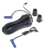
TMF pár fotobuněk pro optickou citlivou hranu