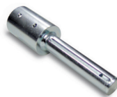
CRA9 adaptér pro hřídele s průměrem 31.75 (1.1/4"), 35 a 40 mm