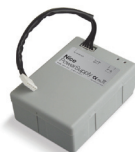
PS124 24V baterie se zabudovaným dobíjením